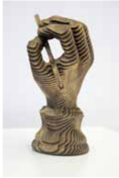
The Artist's Hand 2012 patinierter Karton Höhe 19 cm

1978 * in Düsseldorf 1997-2003 Weiterbildung zum Steinbildhauermeister in Düsseldorf 2005-07 Arbeitsaufenthalt in Carrara / Italien seit 2006 Symposien und Ausstellungen im In- und Ausland 2009-13 Studium Digital Film Design an der Babelsberg Film School lebt in Berlin