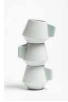
Grip 2014 Weichporzellan, glasiert 7,5 x 8,7 x 8,7 cm

1990 * in Weißenfels 2010-14 Studium des Textil- und Flächendesigns an der Kunsthochschule Berlin-Weißensee (BA) seit 2012 Stipendiatin des Kölner Gymnasial- und Stiftungsfonds 2013 Gastsemester an der Royal Danish Academy – School of Design Kopenhagen (DK) 2014/15 Studium des Produktdesigns mit Schwerpunkt Porzellan an Hochschule für Kunst und Design Halle Burg Giebichenstein (MA) seit 2015 Fortführung des Produktdesignstudiums (MA) an der Kunsthochschule Berlin-Weißensee und Mitarbeit im Studio Mark Braun