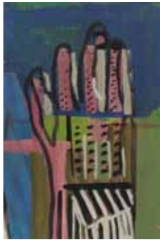
Finnischer Handschuh 2009 Gouache 30 x 19 cm

1947 * in Zeitz 1969-79 Medizinstudium und mehrjährige Tätigkeit am Anatomischen Institut Rostock seit 1976 zahlreiche Ausstellungen und Projekte im In- und Ausland seit 1979 freiberuflich als Maler und Bildhauer 1985-90 Leitung der Abteilung Künstleranatomie an der Hochschule für Bildende Künste Dresden seit 1990 Lehrtätigkeit an der Kunsthochschule Berlin-Weißensee 1993 Berufung zum Professor 2015 Losito Kunstpreis 2015, Ehrenpreis lebt in Hohen Neuendorf b. Berlin