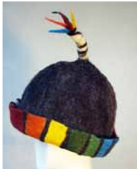
Filzkappe „Insel“ 2015 Filztechnik, Schatwolle, Naturfarben

* in Salzwedel Abitur technisches Diplom an der TU Dresden seit 1986 Beschäftigung mit Naturfasern, Färben mit Pflanzenfarben erste Filzarbeiten Kurstätigkeit seit 1990 Ausstellungen im In- und Ausland seit 1992 Mitglied im Berufsverband Bildender Künstler seit 1996 Atelier an der Weide in Gersdorf seit 1997 konzeptionelles Arbeiten (Objekte: Textil / Holz)