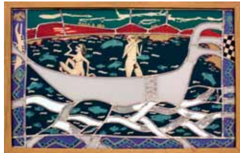
An der chinesischen Mauer 1992 Bleiverglasung mit Hinterglasmalerei 68 x 93 cm

1960 * in Halle an der Saale 1976-78 Glaserlehre 1978-80 Abitur 1980-85 Studium an der Kunsthochschule Burg Giebichenstein, Fachbereich Glasgestaltung seit 1985 freischaffend als Glasgestalterin und Malerin in Potsdam Mitglied im BVBK seit 1988 Ausstellungen im In- und Ausland lebt in Potsdam