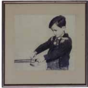
das kannst auch du 2003 Objekt, Detail 15 x 15 cm

1973 * in Erlangen 1995-99 Studium an der Akademie der Bildenden Künste in Nürnberg 1998/99 Gaststudium an der Ecole des Beaux Arts de Lyon 1999 Meisterschülerin AdBK Nürnberg 2000 Studium an der Kunsthochschule Berlin-Weißensee 2003 Diplom Freie Kunst/Bildhauerei seit 2006 freie Mitarbeiterin an den Staatlichen Museen zu Berlin seit 2008 lebt in Berlin 1997 erster Preis der 3rd International Student Art Biennial Skopje 1998 Stipendium des Deutsch-Französischen Jugendwerks