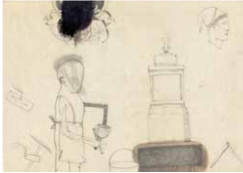
Maurer 1998 Bleistift, Tusche auf Karton 21 x 29,7 cm

1962 in Erfurt geboren, aufgewachsen in Ost-Berlin und Moskau 1979-84 Lehre und Arbeit als Dekorationsmaler 1985 Flucht aus der DDR, Aufenthalt im Ruhrgebiet 1986 Beginn der freiberuflichen Tätigkeit als Maler und Lackierer 1991 Rückkehr nach Berlin ab 1993 Schaffensbereich zunehmend im Zusammenhang von Theater und Musik 2007 Stipendium des Landes Mecklenburg-Vorpommern für einen Arbeitsaufenthalt im Künstlerhaus Lukas Ahrenshoop 2012 Losito Kunstpreis 2012