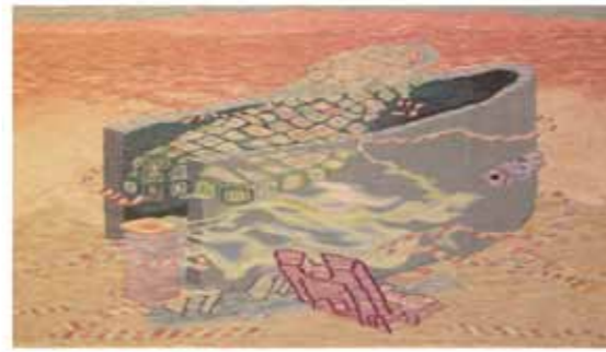
Techno 1998 Wolle, Seide auf Baumwolle 100 x 175 cm