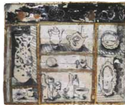
Küchenplatte 2015 Steingut 20 x 23 x 4 cm

1953 * in Berlin 1979 Diplom an der Burg Giebichenstein (damals Hochschule für industrielle Formgestaltung) in Halle/Saale, Fach Keramik Hochschule für Angewandte Künste UMPRUM Prag seit 1981 freiberuflich in der eigenen Werkstatt in Zepernick Lehraufträge, zahlreiche Symposien, Arbeitsaufenthalte und Ausstellungen 1994-2007 Professur im Bereich Plastik/Keramik an der Burg Giebichenstein 1999 Mitglied der Internationalen Akademie für Keramik lebt in Zepernick bei Berlin