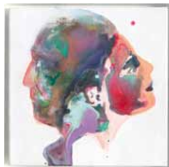
KATRIN KAMPMANN Januskopf # 3 2012 Öl auf Leinwand 40 x 40 cm