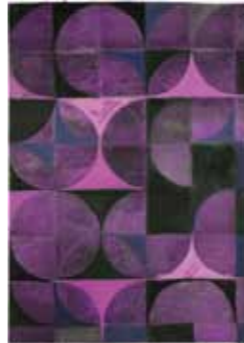
Rebecca Michaelis 3_13 2013 Gouache, Tusche auf Papier 29,7 x 21 cm