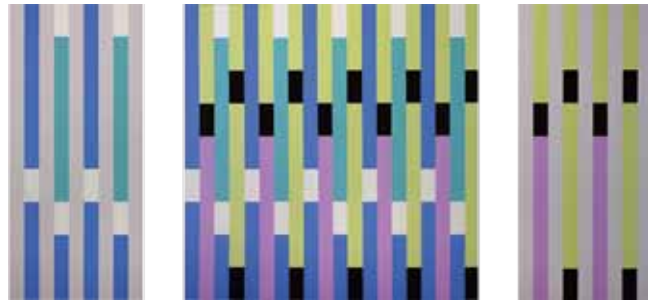
horst bartnig trptychon 6 / 30 / 6 unterbrechungen 2004 acryl auf leinwand 160 x 68, 160 x 160, 160 x 68 cm