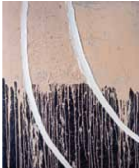
Bernd Kerkin works on Eva Hesse 99 2008 Acryl auf Leinwand 120 x 100 cm