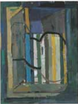
Manfred Zoller Streifenwelt 2006 Öl auf Hartfaser 81 x 61 cm