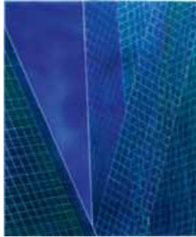
Monika Jarecka voran 2012 Acryl, Fasermaler auf Leinwand 120 x 100 cm