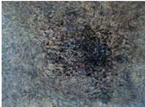
Christine Hielscher Transformation I 2013 Acryl auf Leinwand 155 x 210 cm