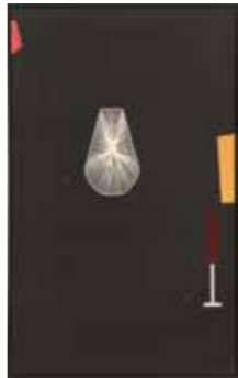
Meik Stamer Après Moi 2011 Wolle, Acryl auf Baumwolle 160 x 100 cm