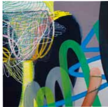
Claudia Chaseling scape I 2010 Etempera, Öl auf Leinwand 145 x 145 cm