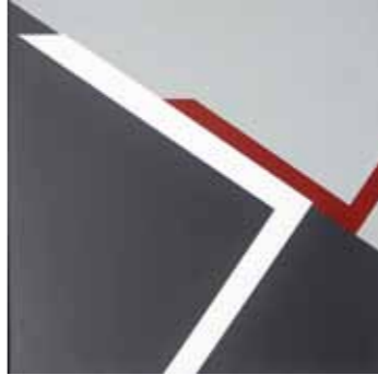
Helmut Senf ohne Titel 2003 Acryl auf Leinwand 70 x 70 cm