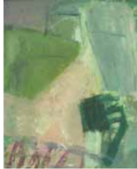
Carsten Gille Interieur 2008 Öl auf Leinwand 50 x 40 cm