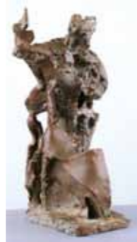
Sylvia Hagen Heilige Barbara 2004 Bronze 45 x 25 x 24 cm