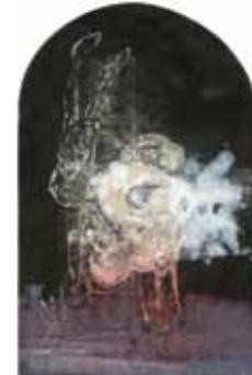
Frank Seidel Auferstehung 2008 Öl auf Leinwand 233 x 145 cm