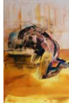
Regina Nieke o.T. 2012 Spray, Öl auf Leinwand 150 x 100 cm