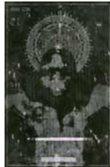
Dietmar Kohler Vera Leon II 2005 Radierung, Aquarell, Reservage, Körperabdruck 75 x 48,5 cm