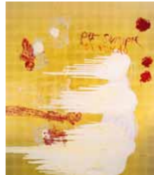
Robert Weber Per sempre ti rivedo 2006 Malerei auf Goldgrund auf Holz 230 x 200 cm