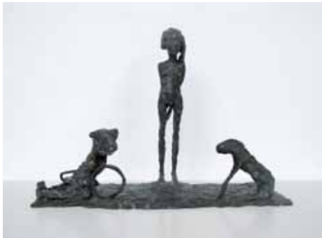
Kerstin Grimm Eva 2002/2011 Bronze 21 x 28 cm