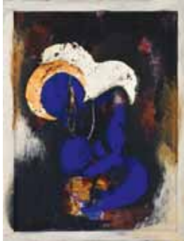
Dorit Bearach blaue Madonna 2008 Mischtechnik auf Hartfaser 110 x 85 cm