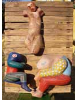
Erika Stürmer-Alex Kruzifix 1976 Styropur, Plakattarbe auf Fundholz 110 x 81 x 35 cm