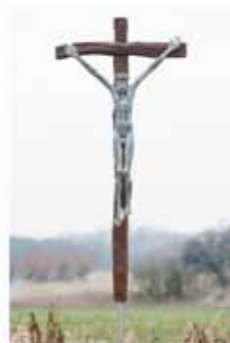
Hans Scheib Kruzifix 2000 Bronze 213 x 70 cm