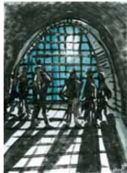
Jürgen K. Hultenreich o.T. 2011 Tusche 18 x 12,1 cm